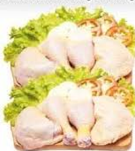
Coxa e Sobrecoxa de Frango a Granel kg