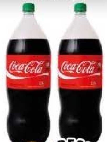
Coca-Cola Pet 2,5l