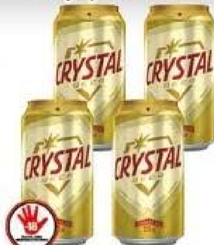
Cerveja Crystal Lata 350ml