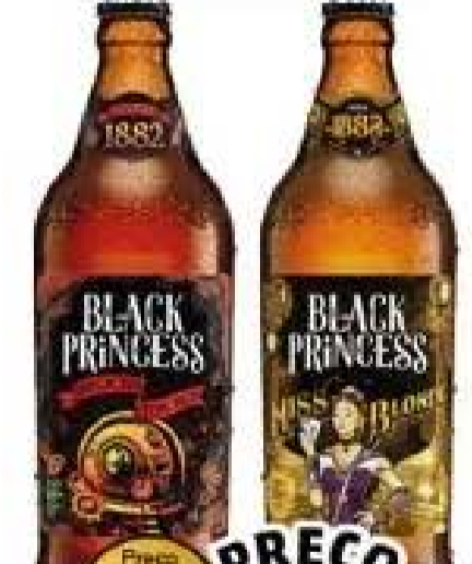
Cerveja Black Princess Garrafa 600ml Back To The Red/ Miss Blond