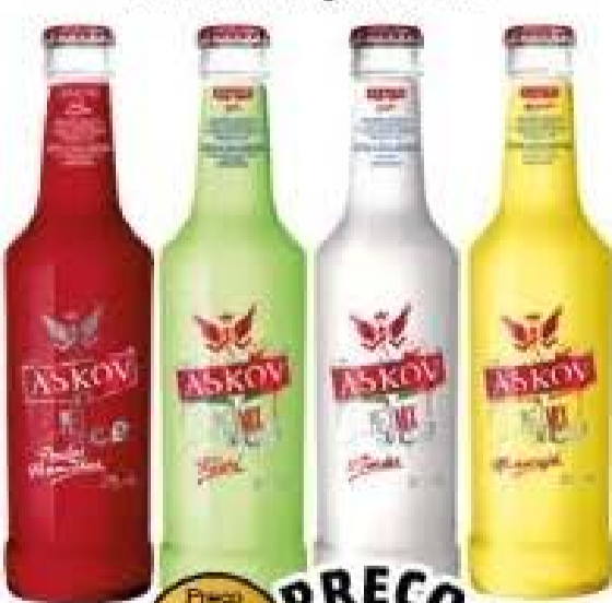
Vodka Askov Long Neck 275ml