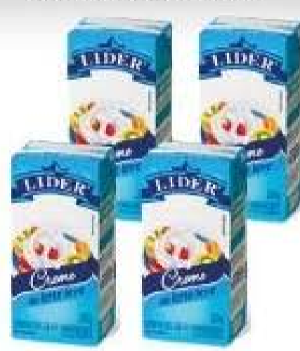
Creme de Leite Líder TP 200ml