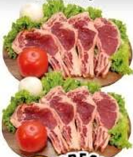
Bisteca Bovina kg

OFERTAS VÁLIDAS PARA 24/09 DE 2022 OU ENQUANTO DURAREM OS ESTOQUES.